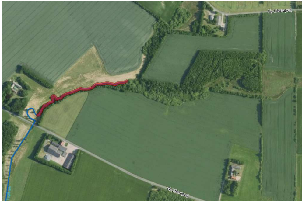
Figur 1. De røde linjer viser projektstrækningerne i Fuglbæk st. 650-1005 m.

Formålet med projektet er at genskabe tabte gyde- og opvækstområder for blandt andet laksefisk, og skabe bedre fysiske forhold ved at etablere et sandfang og udskifte bundmaterialet på projektstrækningen mellem st. 650-1005 m (Figur 1). Projektet er udarbejdet i henhold til statens Vandområdeplan 2015-2021.